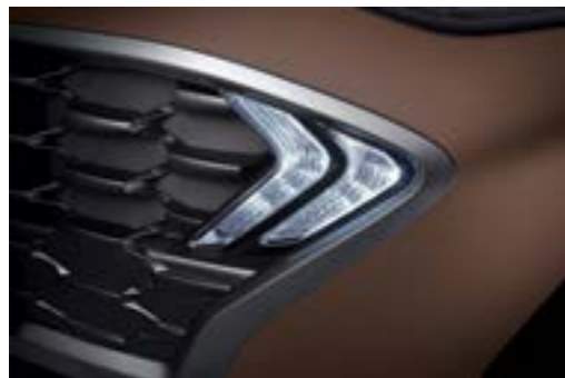
Cụm đèn ban ngày DRL (Daytime Running Light) được thiết kế phá cách dạng boomerang