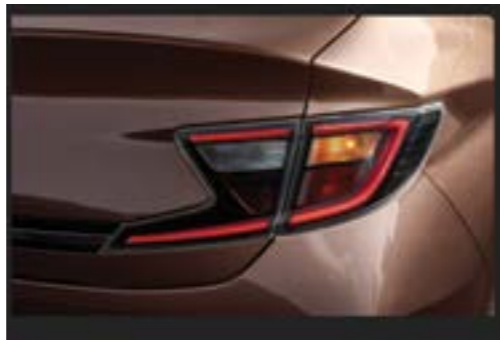
Đèn hậu dạng LED thiết kế cách điệu, đồng bộ với cụm đèn phía trước