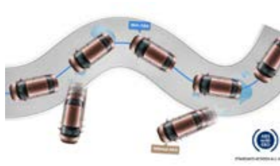
Hệ thống phanh ABS kết hợp EBD