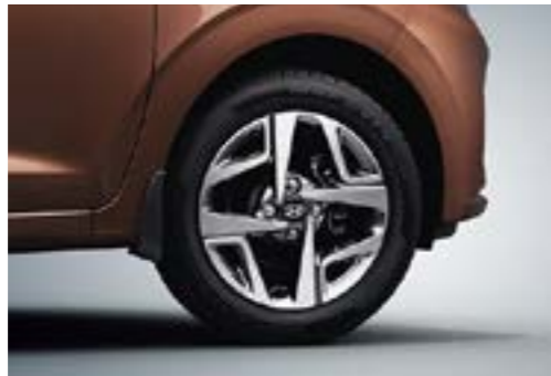
Vành hợp kim 15 inch cao cấp tạo hình trẻ trung