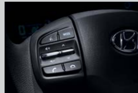
Cụm điều chỉnh media tích hợp nhận diện giọng nói