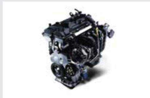
Động cơ Kappa 1.2L mang đến khả năng vận hành êm ái, ổn định cùng với khả năng tiết kiệm nhiên liệu nhưng vẫn đáp ứng được nhu cầu vận hành của khách hàng.