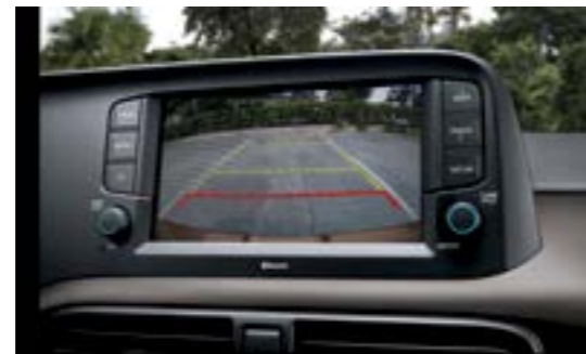
Camera lùi hỗ trợ đỗ xe