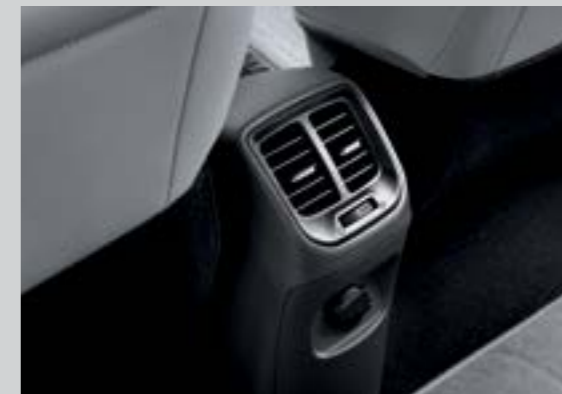
Cửa gió điều hòa hàng ghế thứ 2