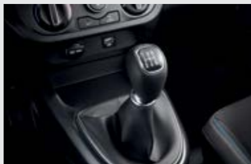
Hộp số sàn 5 cấp Mang đến khả năng vận hành bền bỉ và tiết kiệm nhiên liệu