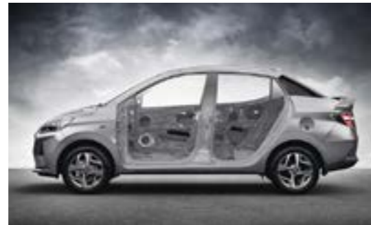
Hệ thống khung mới cứng vững hơn với thép cường độ cao