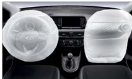
Hệ thống an toàn 2 túi khí