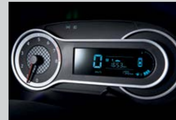
Màn hình thông tin thiết kế thể thao