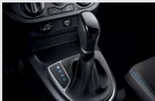
Hộp số tự động 4 cấp Được tối ưu để tạo nên sự cân bằng giữa niềm vui lái xe và khả năng tiết kiệm nhiên liệu