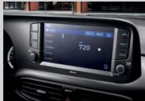
Màn hình giải trí 8 inch

All New Grand i10 sedan sẽ mang đến cho bạn sự rộng rãi đầy bất ngờ. Không chỉ rộng rãi All New Grand i10 còn mang đến sự tiện nghi giúp hành khách tận hưởng các hành trình.