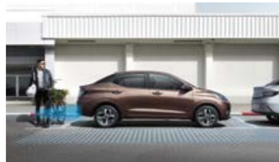
Cảm biến va chạm phía sau