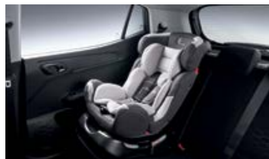
Ghế an toàn trẻ em ISO FIX