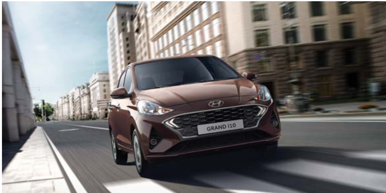
Cụm lưới tản nhiệt hình đan hình lục giác cùng với đường dập nổi trên mũi xe và dọc thân xe tạo nên nét trẻ trung