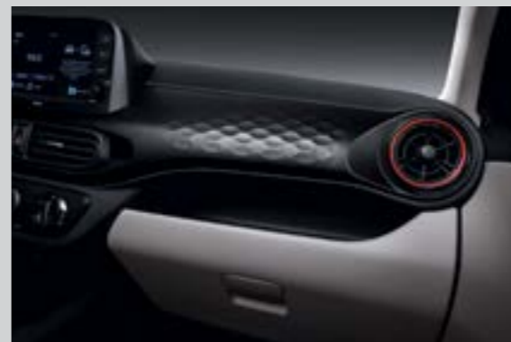
Khay để đồ tiện ích với phần ốp tạo hình 3D ấn tượng