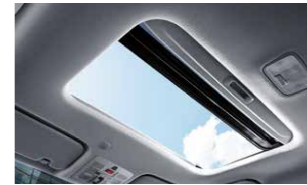
Cửa sổ trời (Phiên bản 1.0T-GDi Đặc biệt)