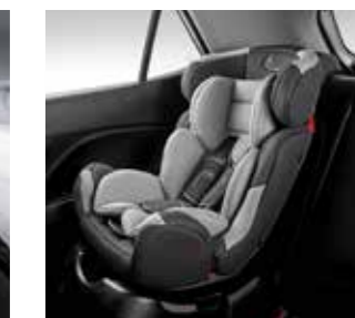
Ghế ISOFIX hàng ghế 2