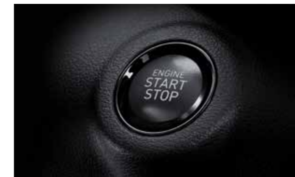
Khởi động bằng nút bấm