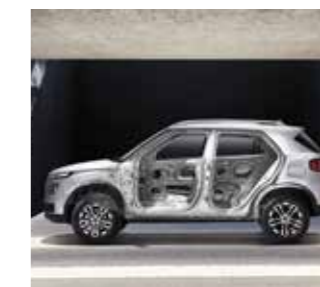
Hệ thống khung gầm chứa 65% vật liệu chịu lực cao