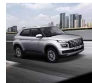
Hệ thống cân bằng điện tử