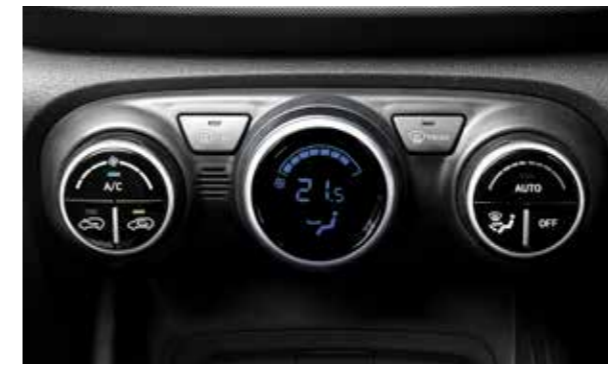
Điều hòa tự động (Phiên bản 1.0T-GDi Đặc biệt)