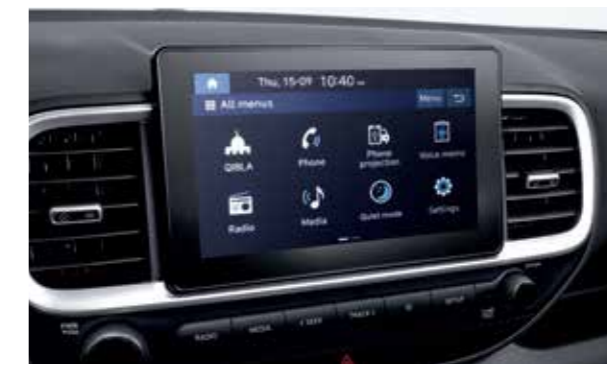
Màn hình giải trí 8 inch