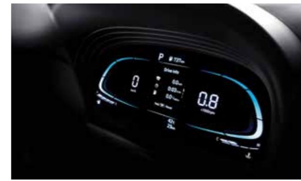
Màn hình thông tin Kỹ thuật số

Nhỏ bên ngoài nhưng lớn bên trong, VENUE mang đến không gian cabin đáng kinh ngạc với mức độ thực dụng cao cùng các tính năng hiện đại.