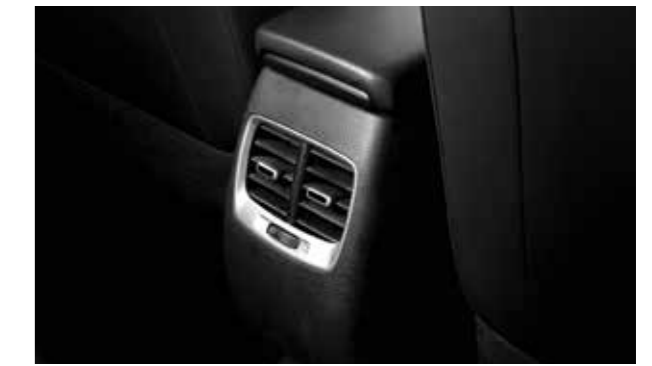
Cửa gió điều hòa hàng ghế 2