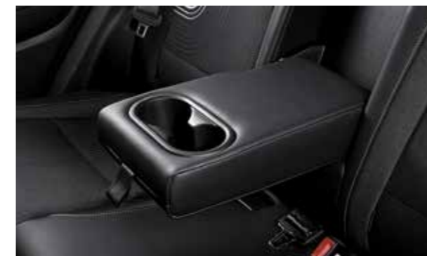
Tựa tay hàng ghế 2