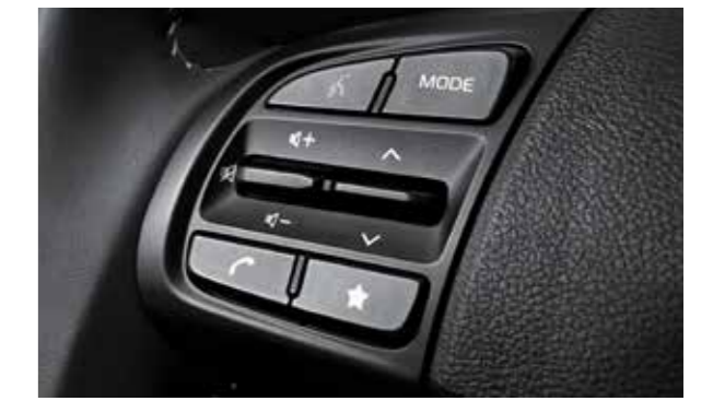
Cụm điều khiển Media