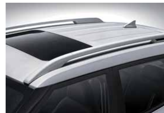
Giá nóc và cửa sổ trời (Phiên bản 1.0T-GDi Đặc biệt)