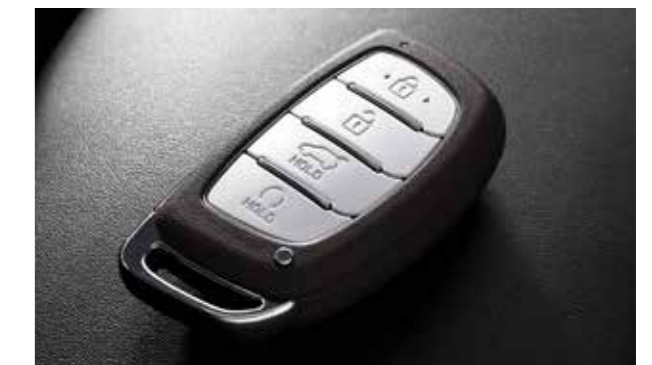
Smartkey tích hợp khởi động từ xa