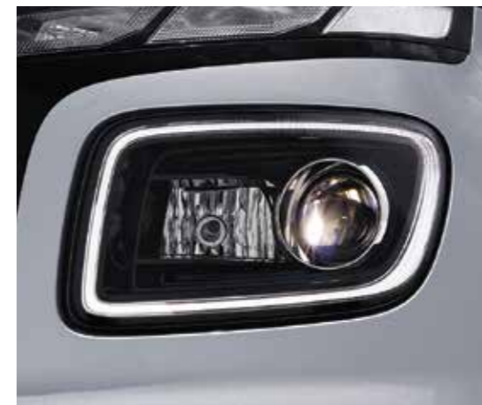
Đèn chiếu sáng LED Projector (Phiên bản 1.0T-GDi Đặc biệt)

Thiết kế lưới tản nhiệt mở rộng sang hai bên được hoàn thiện bằng Chrome bóng mang đến phong cách thể thao, mạnh mẽ cho VENUE