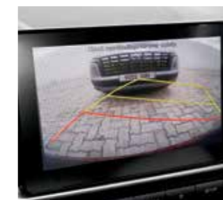
Camera hỗ trợ lùi xe