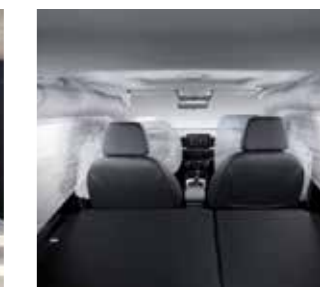
Hệ thống 6 túi khí (Phiên bản 1.0 T-GDI Đặc biệt)