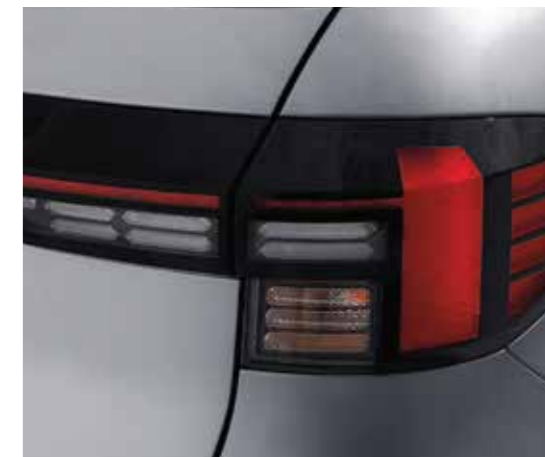
Cụm đèn hậu dạng LED