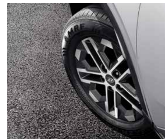
Vành hợp kim 16 inch