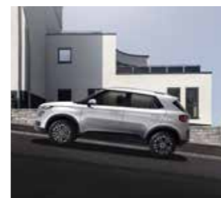
Hệ thống hỗ trợ khởi hành ngang dốc